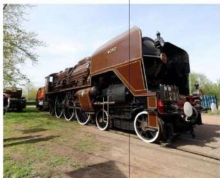
Il y a aussi à voir d'anciennes machines restaurées.