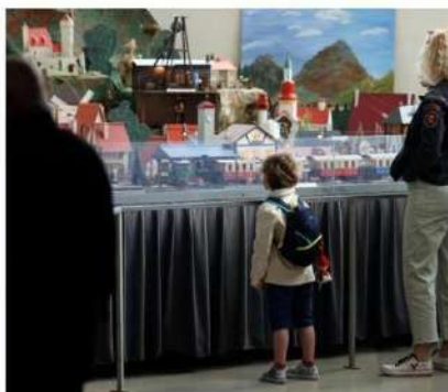
Toutes les générations se retrouvent dans cette exposition.