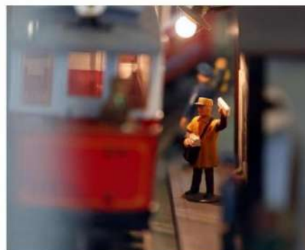
Le souci du détail émerge.